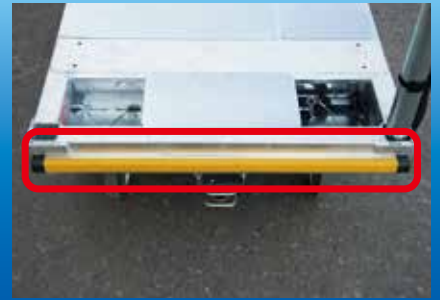
衝突停止バンパースイッチ(前後)