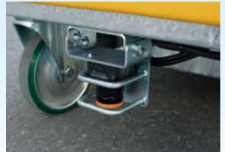
追従感知センサー