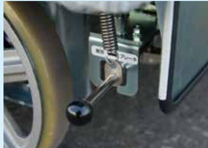
電磁ブレーキ解放装置