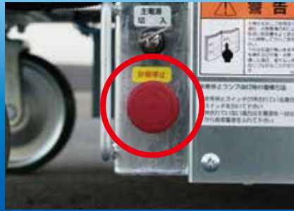
非常停止スイッチ