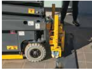
段差を検知すると動作を停止