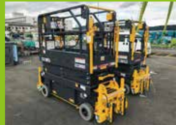
建トウン6m(手前)と4.5m(奥)