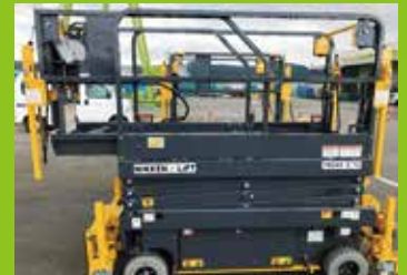
作業床がスライド