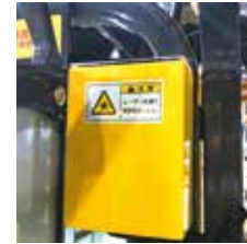
レーザーポインタBOX