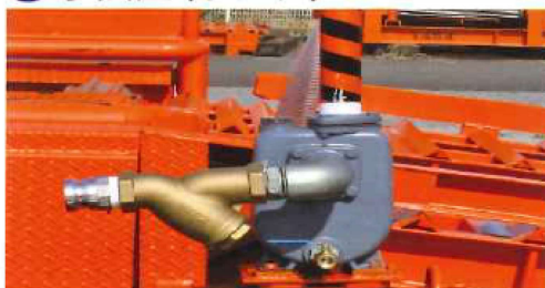
⑦ 水装置 (ポンプ)