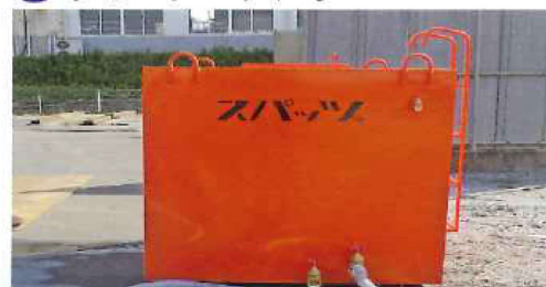
⑧ ウォータータンク