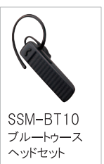
SSM-BT10 ブルートゥース ヘッドセット

オプションのブルートゥースヘッドセットSSM-BT10を使用したワイヤレス通信が可能です。SSM-BT10はノイズキャンセル機能によるクリアな送信音質で業務連絡をサポートします。SSM-BT10は一度の充電で約20時間使用することができます。(使用時間は、同時通話連続運用時を想定)