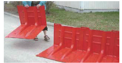
ボックスウォールを背後から見て左から右に並べる