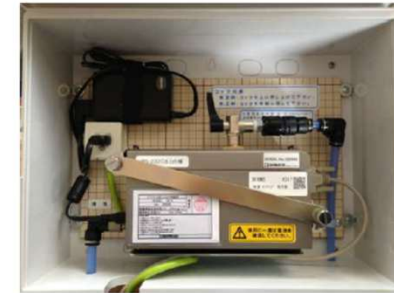
内部 (デジタル粉塵計 LD-5)