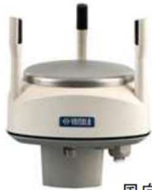
風向風速センサー (オプション) 商品CD:DFKFS