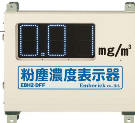
表示板&データ記録装置