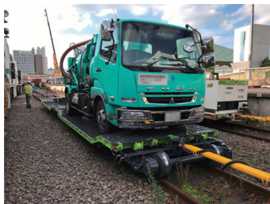
車両積載イメージ