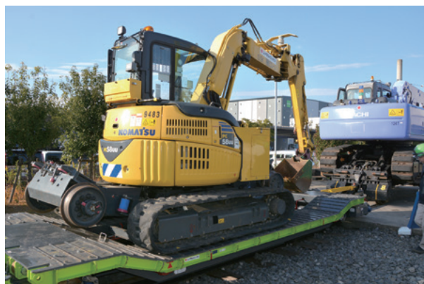
8t軌陸クレーンで牽引