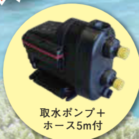
取水ポンプ + ホース5m付